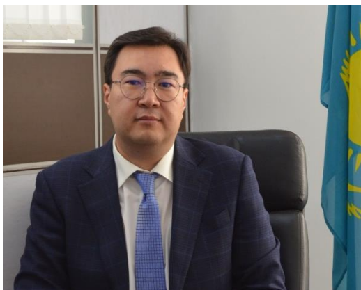
Ерлан ГАЛИЕВ Председатель Правления АО «Национальная геологическая служба»