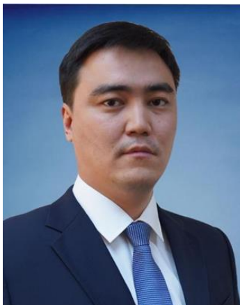
Иран ШАРХАН Председатель Совета директоров АО «Национальная геологическая служба», Вице-министр индустрии и инфраструктурного развития РК